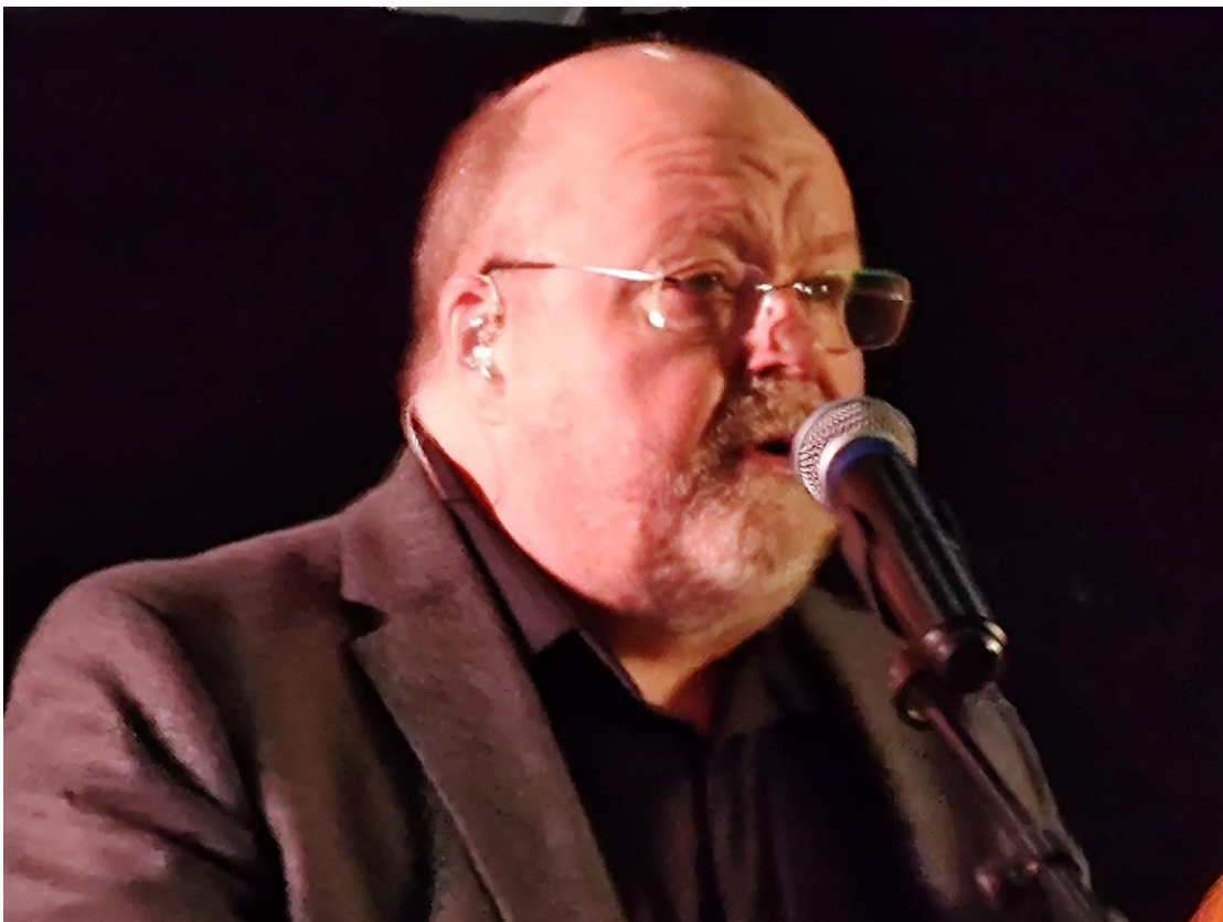
Kalle Moraeus var en uppskattad artist i regionens jubileumskonserter i Nykarleby och i Kristinestad