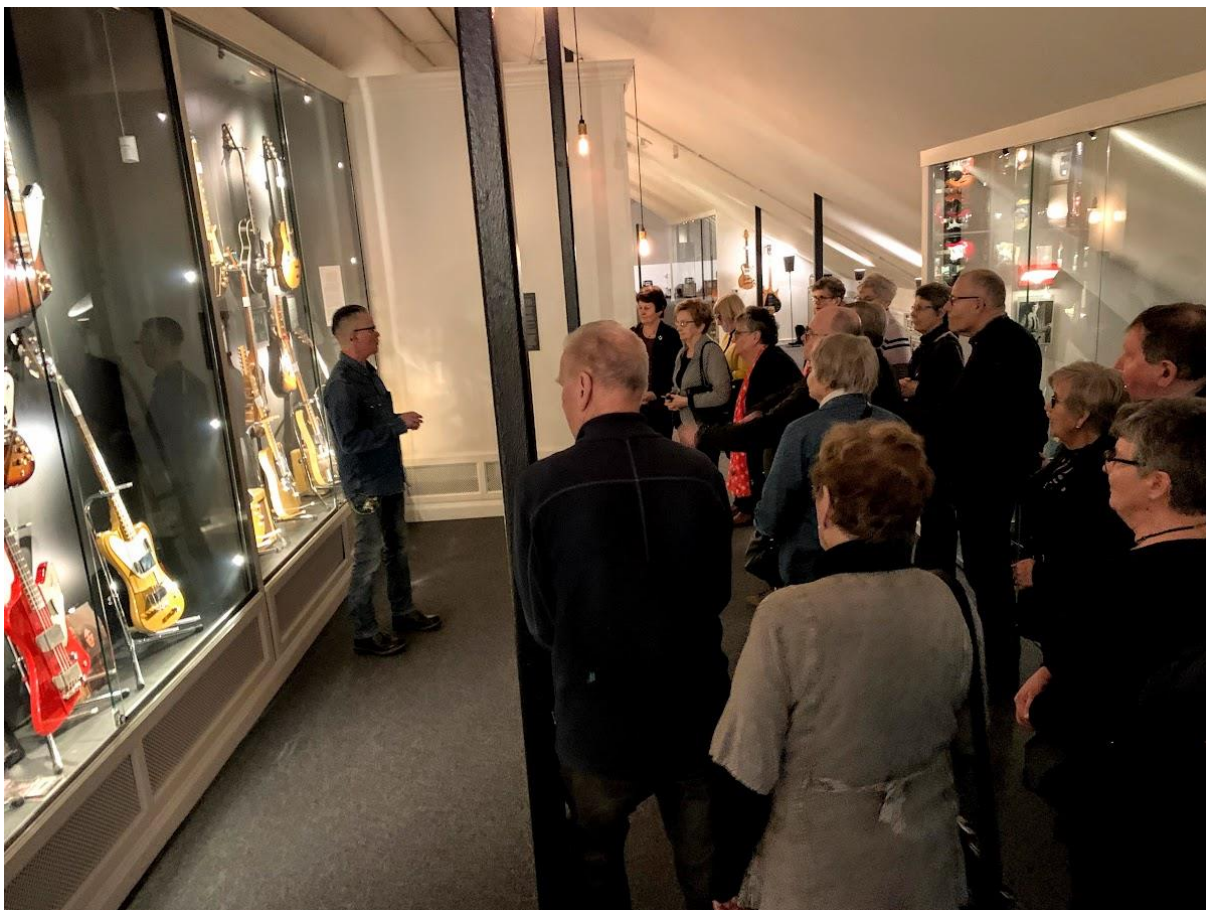
Besök på "Guitars – The Museum" i Umeå i samband med resekoordinatorträffen.

Ordförandekonferens hölls 4 mars på Yrkesakademin i Vasa. Syftet med konferensen var att föreningsaktiva tillsammans skulle kunna diskutera om styrelsearbetet och vilka möjligheter det finns att utveckla både styrelsens, föreningens och hela regionens arbete.