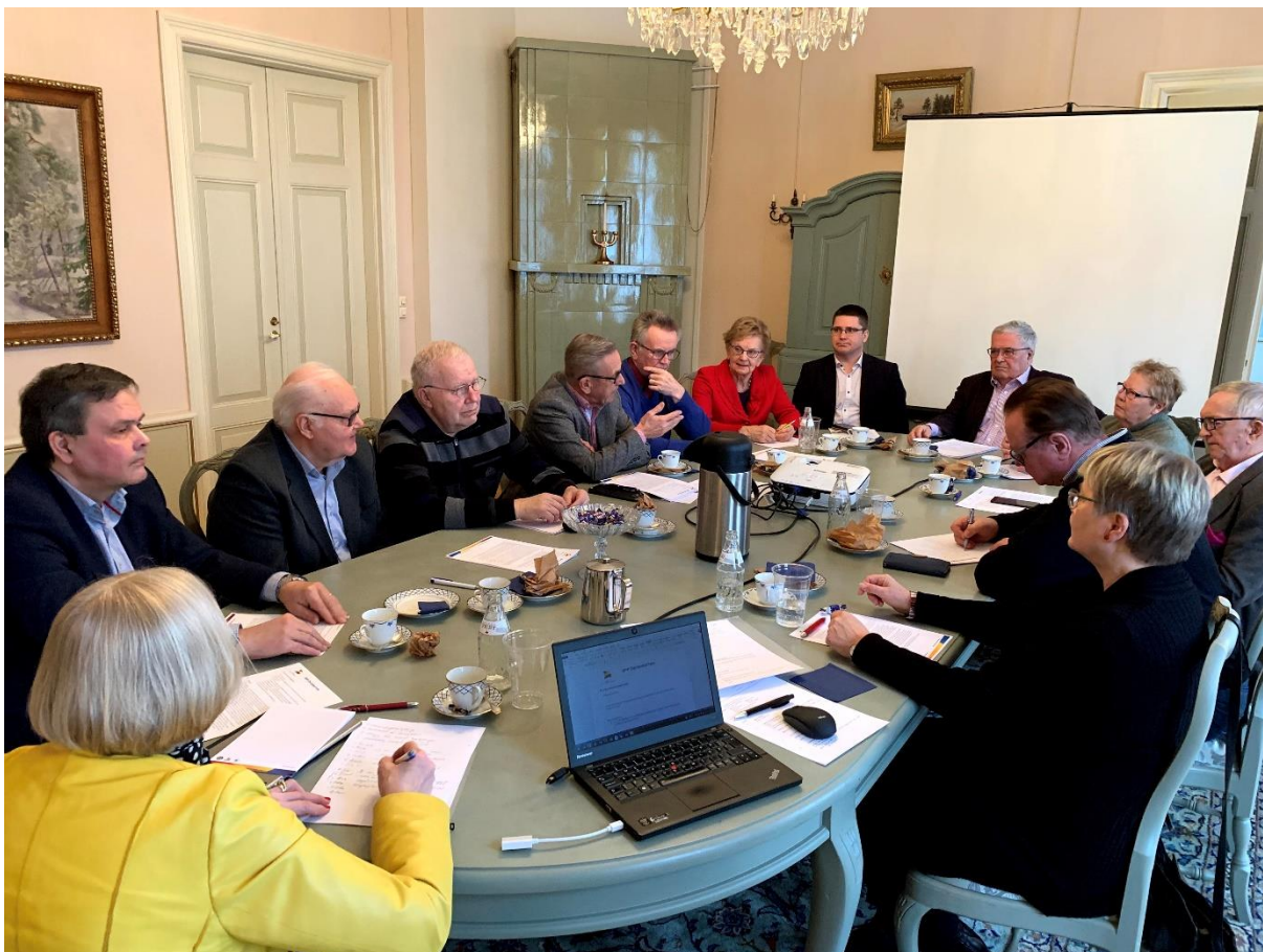
Styrelsen höll sitt årliga samråd med svensk- och tvåspråkiga riksdagsmän från Vasa valkrets 30 januari.