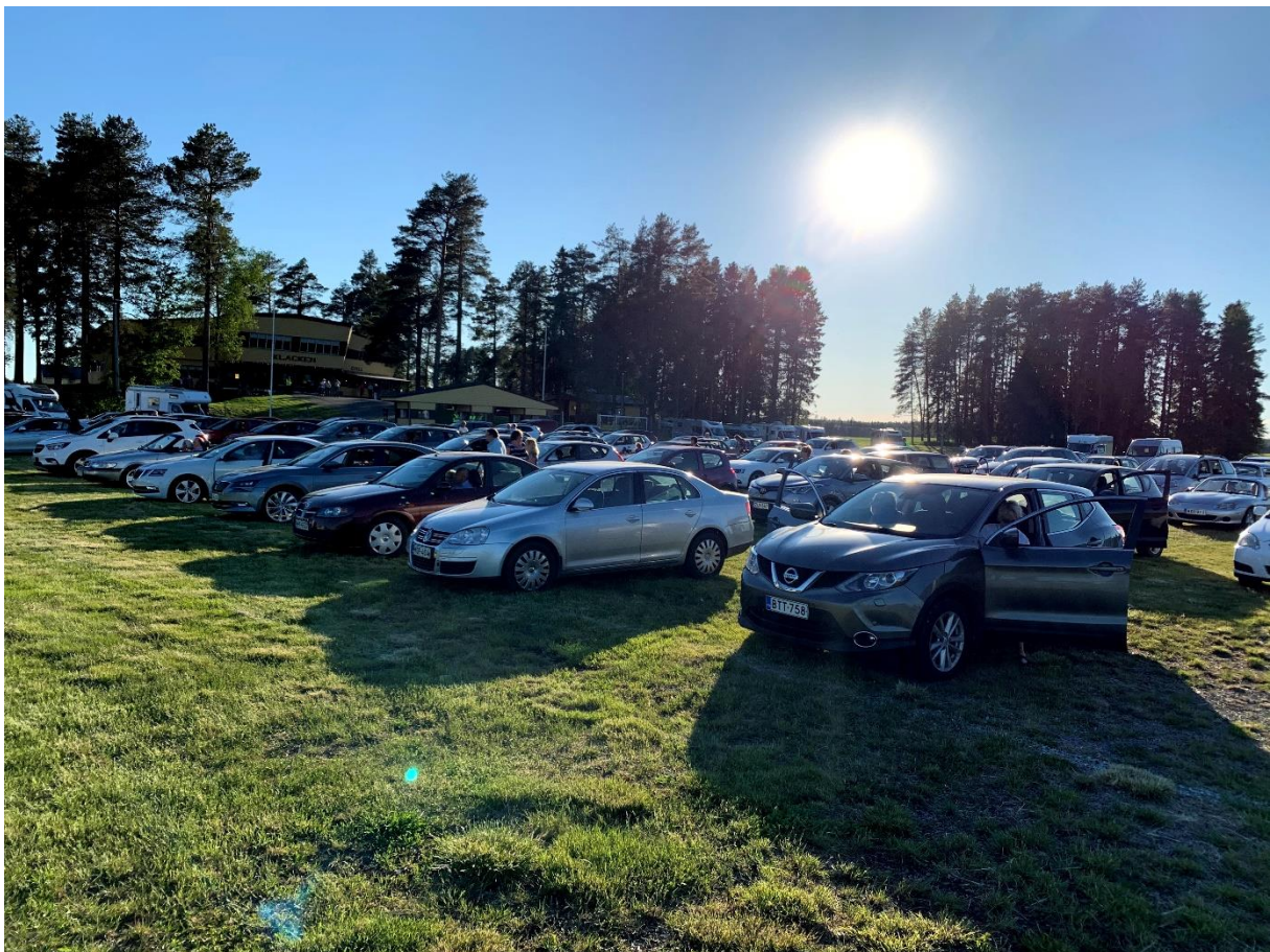
Vädret visade sin bästa sida när publiken njöt av drive-in konserten

Tommys spelade på en utescen och publiken körde in på parkeringen och satt i sina bilar och lyssnade på musiken. Konserten som startade klockan 19, samlade omkring 200 bilar med c:a 450 personer. Konserten filmades och streamades via pensionärsförbundets webbplats och förbundets Facebook sida. Dessutom sänds konserten i Lokal-TV kanalerna. Via den rikssvenska Dansbandssidan kunde man följa med konserten även i Sverige.