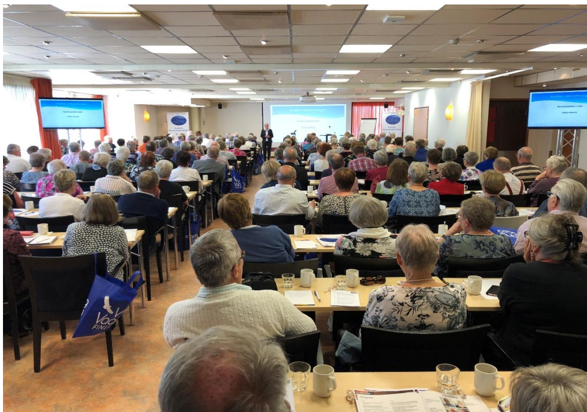
De 174 parlamentsdeltagarna rymdes bra i Tropiclandias konferensutrymme.

Kvarkens pensionärparlament med temat ”Att åldras tryggt” gick av stapeln i Vasa 14-15 maj på hotell Tropiclandia. Målsättningen med projektet var att skapa ett kunskaps- och erfarenhetsutbyte om äldrepolitiken i båda länderna, stärka inflytandet i äldre frågor på flera nivåer och utveckla kontakterna och samarbetet mellan pensionärsföreningarna på båda sidor om Kvarken. Med denna målsättning i åtanke planerades parlamentet och de två dagarna var fulla med faktsäckade föreläsningar och mingel för de 174 deltagarna.