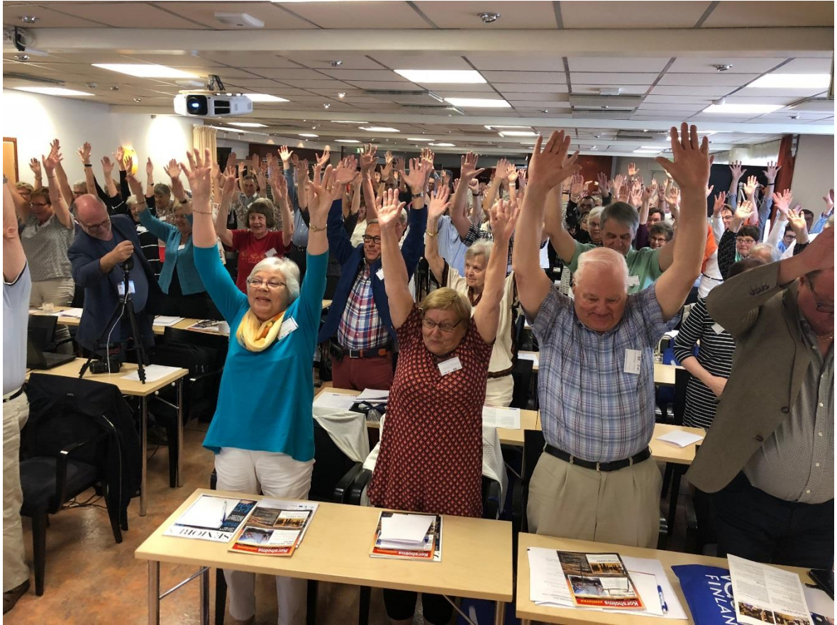
Pausgympa behövs mellan föreläsningarna.