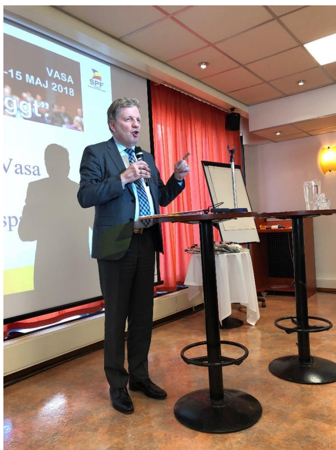
Med sitt anförande inleder Esko Aho Kvarkens pensionärsparlament.

För att underlätta logistiken var alla anmälda deltagare färdigt incheckade och fick nyckel till rummet i handen när de anlände till hotellet. När deltagarna hade lämnat sina väskor på rummen och kommit ner till konferensutrymmet fick alla en kasse med en infofolder, visitkort, Malaxlimpa och broschyrer om Österbotten och Kvarkens världs naturarv.